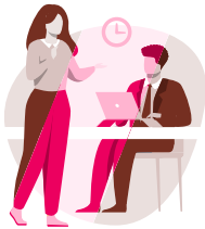
Teamgesprek hybride werken: samenwerking en verbinding

Gebruik onderstaand kwadrant om de activiteiten in kaart te brengen. Schrijf alle activiteiten op post-its. Deze plaats je in de verschillende vakken op het kwadrant. Bespreek dit met het team. Hierbij houd je rekening met elkaar en met de teamdoelen. Maak samen afspraken over hoe je de activiteiten organiseert.