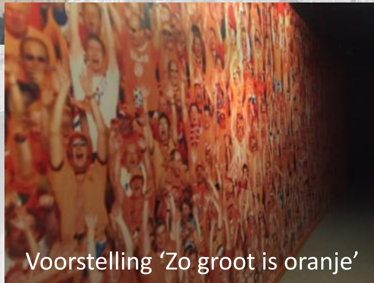
Voorstelling 'Zo groot is oranje'