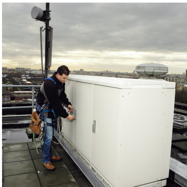
Dakwerker bij zendmast met straalzender en GSM-antennes