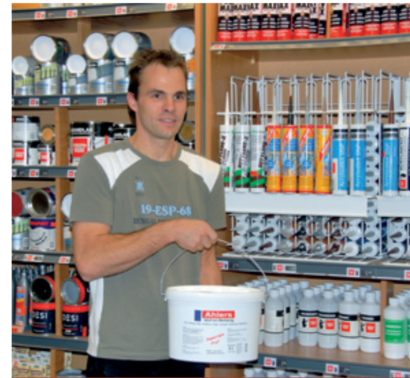
UIT DE PRAKTIJK